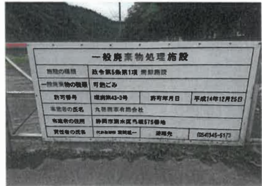
一般廃棄物処理施設