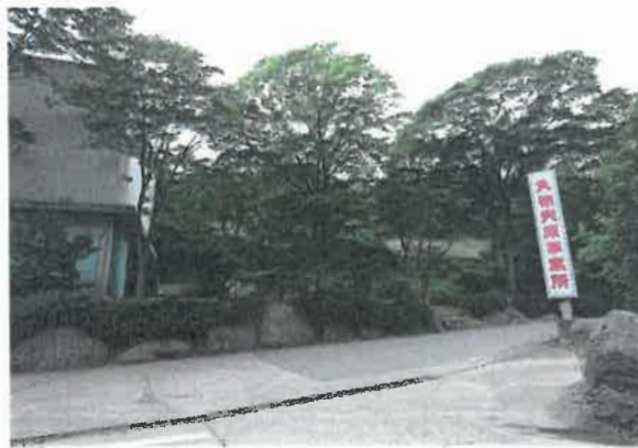
丸徳商事丸原事業所