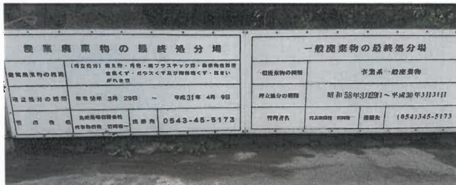
産業廃棄物の最終処分場