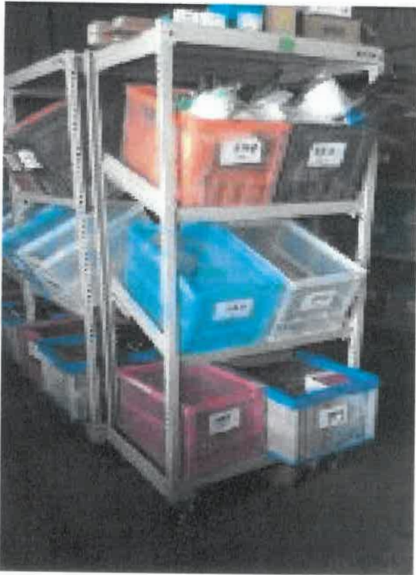
2016年3月購入(個人ラック導入)