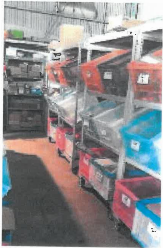
個人ラック導入により歩行スペース確保できました。